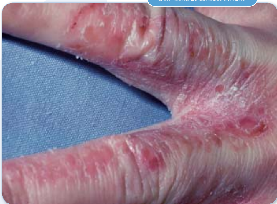
Dermatite de contact irritant

Les coiffeurs et coiffeuses ont tout intérêt à prévenir la dermatite d'irritation ou à entamer sans tarder un traitement radical. En effet, une inflammation par irritation peut entraîner un eczéma allergique de contact , beaucoup plus difficile à traiter.