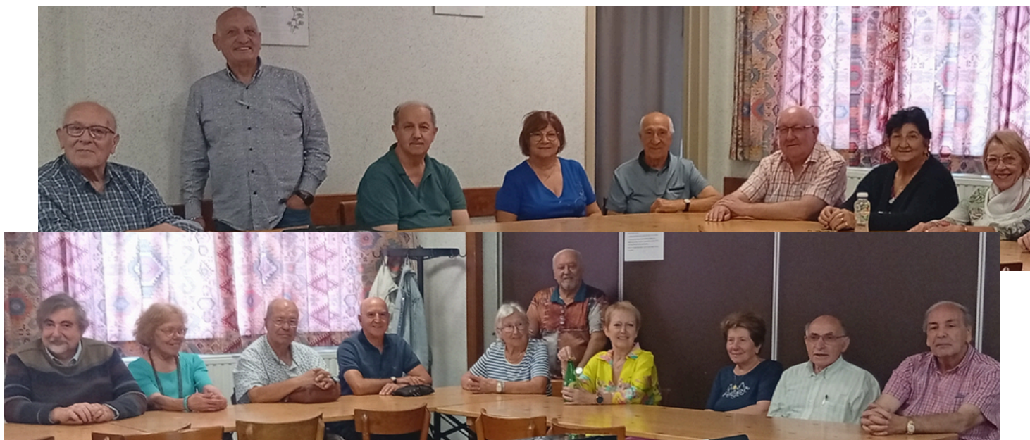
Groupe des Seniors d'Ans